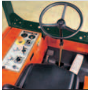
Die Steuerzentrale: Übersichtlich, komfortabel, einfach zu bedienen.