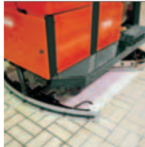
Schmutzwasseraufnahme: Sauber, rückstandslos, mit Stop-Automatik.