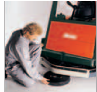
Schneller Bürstenwechsel: Werkzeuglos und mit wenigen Griffen.